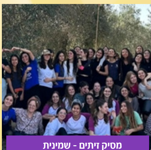
מסיק זיתים - שמינית