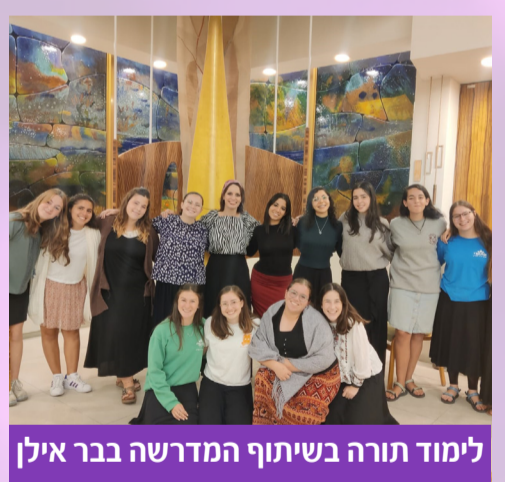
לימוד תורה בשיתוף המדרשה בבר אילן