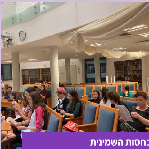
סליחות מוזיקליות בחסות השמינית