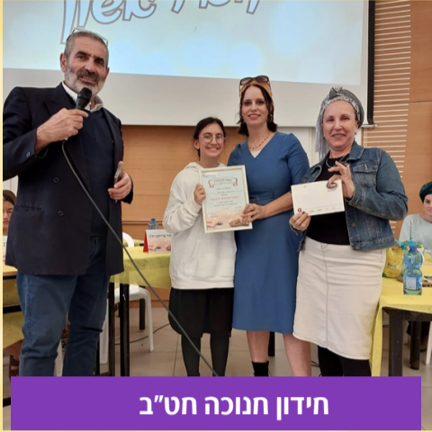
חידון חנוכה חט"ב