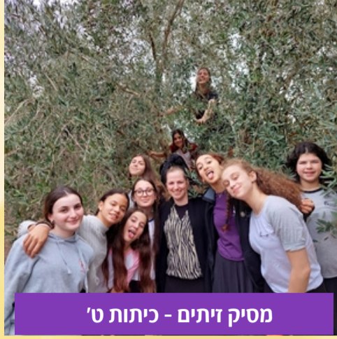
מסיק זיתים - כיתות ט'