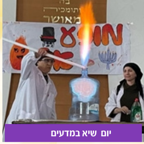
יום שיא במדעים