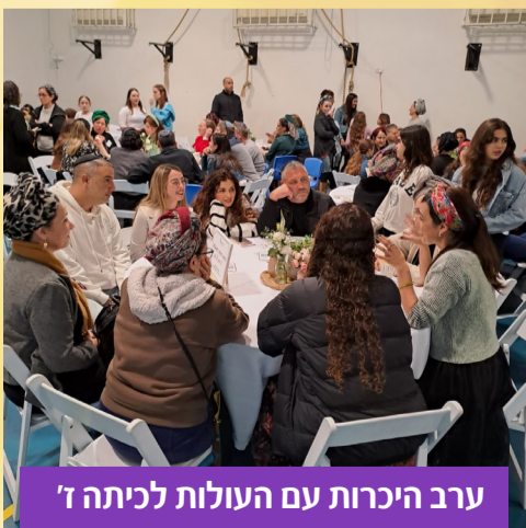
ערב היכרות עם העולות לכיתה ז'