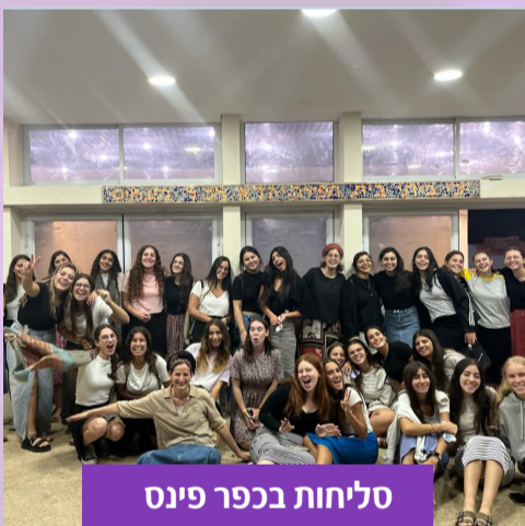
סליחות בכפר פינס