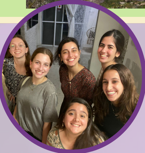
אוהבות מאוד מאוד אזריכותש"י!

אלופות! מחצית שלמה כבר מאחורינו!! קחו לכן רגע, או אפילו כמה. תסתכלו על מה שעברתן והספקתן. מה כבר עשיתן ומה תמיד רציתן לעשות וקצת התפספס. אל תוותרו לעצמיכן. תשאלו שאלות. תביעו דעות. תחקרו כל מה שמעניין אתכן. ואל תתפשרו על עצמכן! תזכרו שכל יום הוא הזדמנות וכל דקה יכולה להיות התחלה. הכל תלוי בכן!