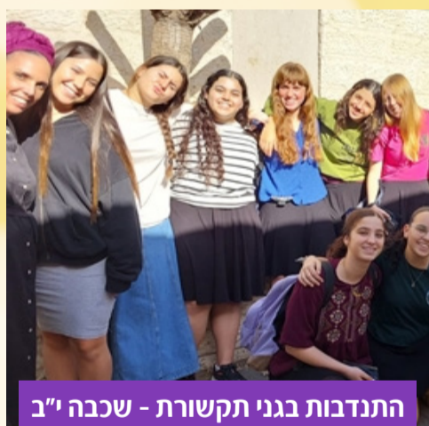
התנדבות בגני תקשורת - שכבה י"ב