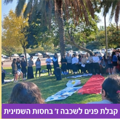
קבלת פנים לשכבה ז' בחסות השמינית