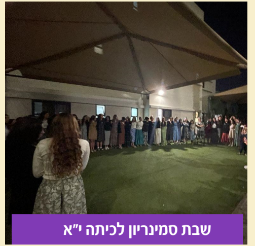
שבת סמינריון לכיתה י"א