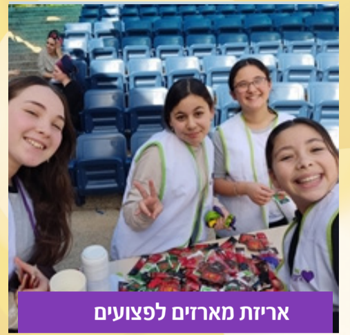
אריזת מארזים לפצועים