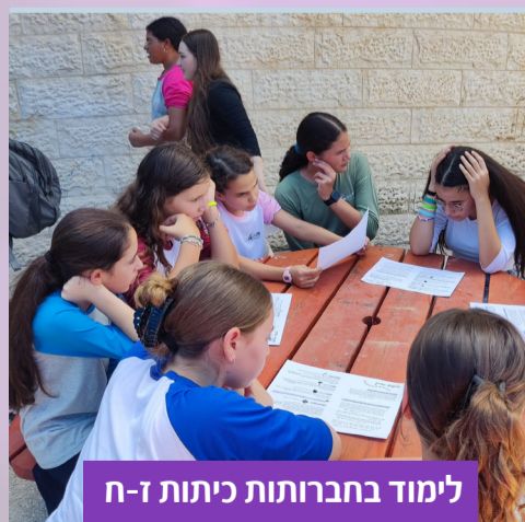
לימוד בחברותות כיתות ז-ח