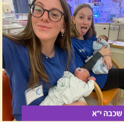
שבוע ירושלים - שכבה י"א