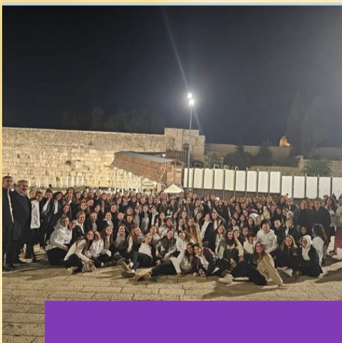
מסע משואה לתקומה - שכבה י"ב