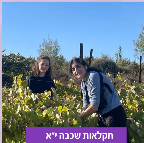
חקלאות שכבה י"א