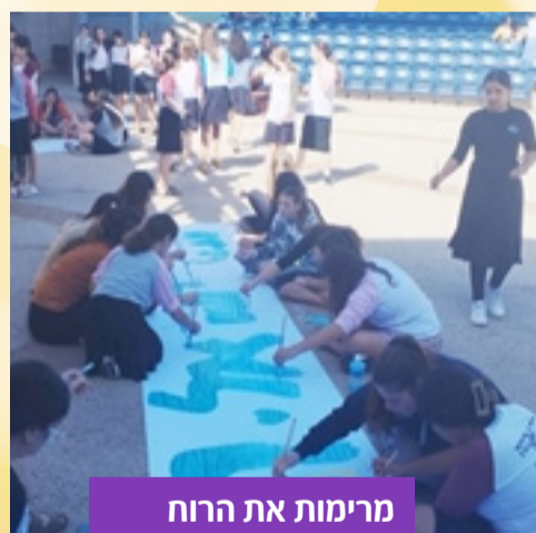
מרימות את הרוח