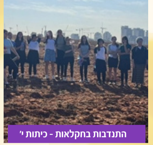
התנדבות בחקלאות - כיתות י'