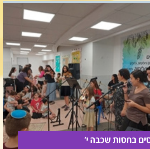
הפנינג לילדי מפונים ומגויסים בחסות שכבה י'