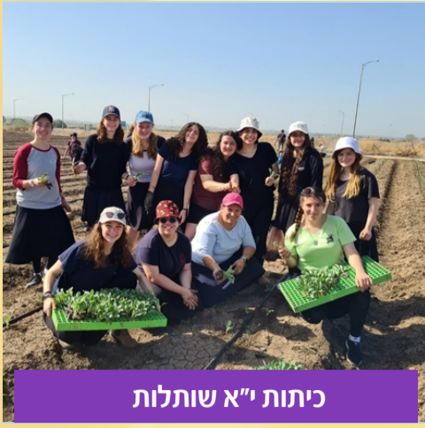
כיתות י"א שותלות