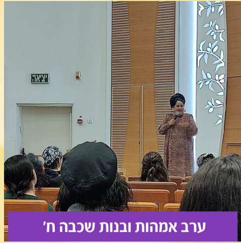
ערב אמהות ובנות שכבה ח'