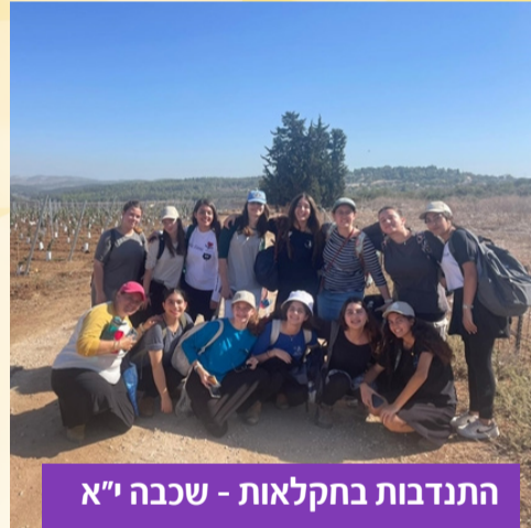
התנדבות בחקלאות - שכבה י"א