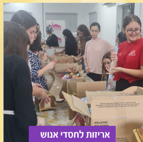
אריזות לחסדי אנוש