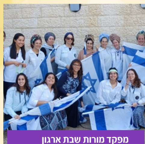
מפקד מורות שבת ארגון