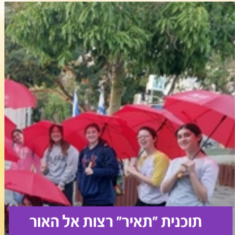
תוכנית "תאיר" רצות אל האור