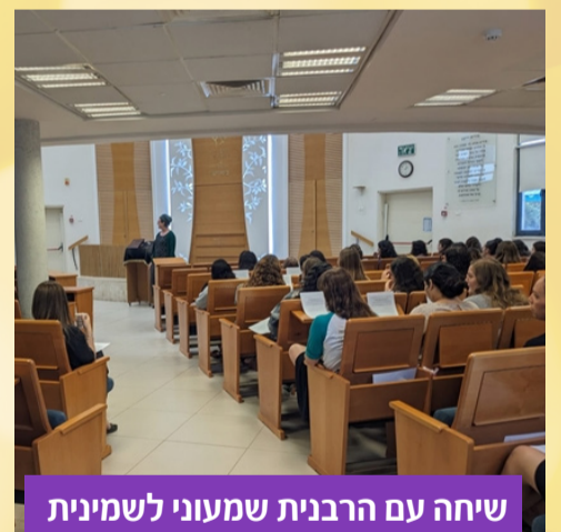
שיחה עם הרבנית שמעוני לשמינית