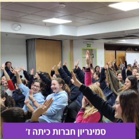
סמינריון חברות כיתה ז'