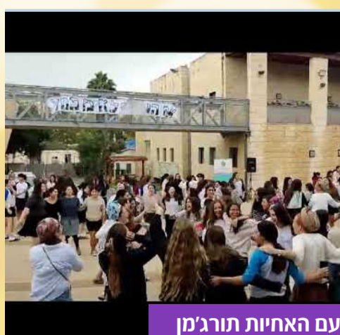
תפילת הלל והרקדת ר"ח עם האחיות תורגמן