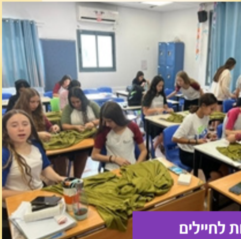
קשירת ציציות לחיילים