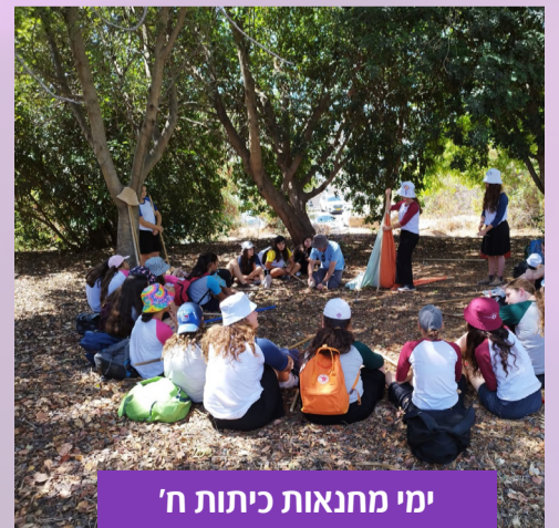
ימי מחנאות כיתות ח'