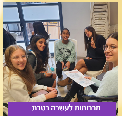
חברות לעשרה בטבת