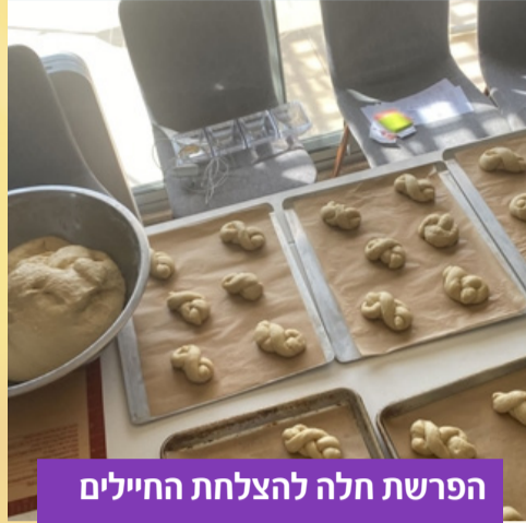
הפרשת חלה להצלחת החיילים