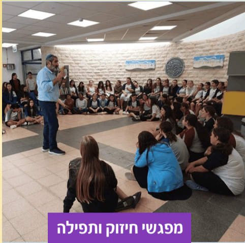
מפגשי חיזוק ותפילה