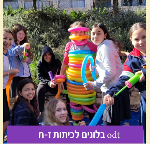
בלונים לכיתות ז-ח

על אף המלחמה, צוות של"ח לא מפספס הזדמנויות לצאת עם הבנות לסיורים וטיולים, כחלק מתוכנית הלימודים. ירושלים, רמלה, תל אביב, הכנה לגיחה (שעוד תגיע! לא לדאוג), ואפילו פה במודיעין, אנחנו בכל מקום ובכל מזג אוויר!