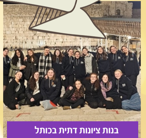
בנות ציונות דתית בכותל