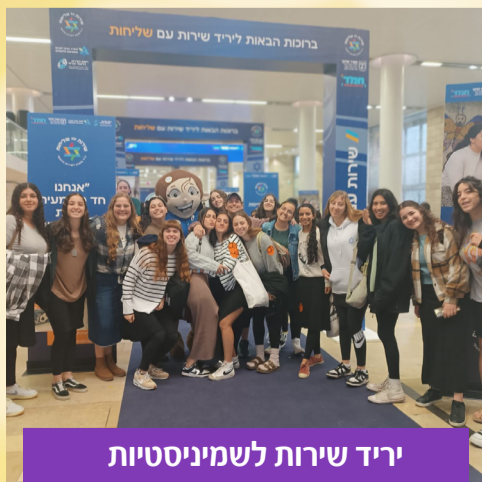
יריד שירות לשמיניסטיות