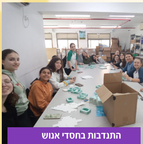
התנדבות בחסדי אנוש