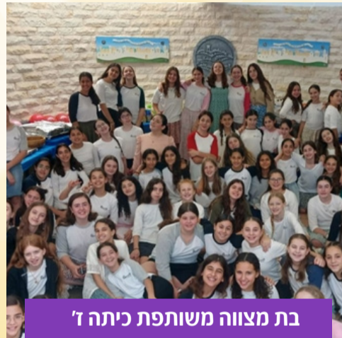
בת מצווה משותפת כיתה ז'