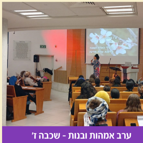
ערב אמהות ובנות - שכבה ז'