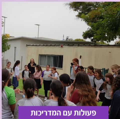
פעולות עם המדריכות