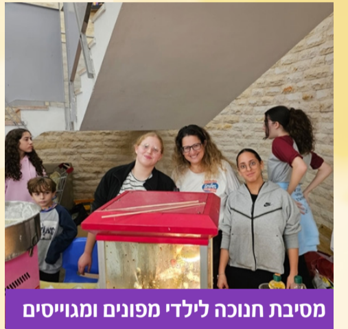
מסיבת חנוכה לילדי מפונים ומגויסים