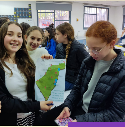
ראש חודש שבט