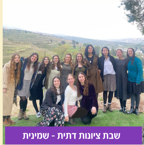
שבת ציונות דתית - שמינית